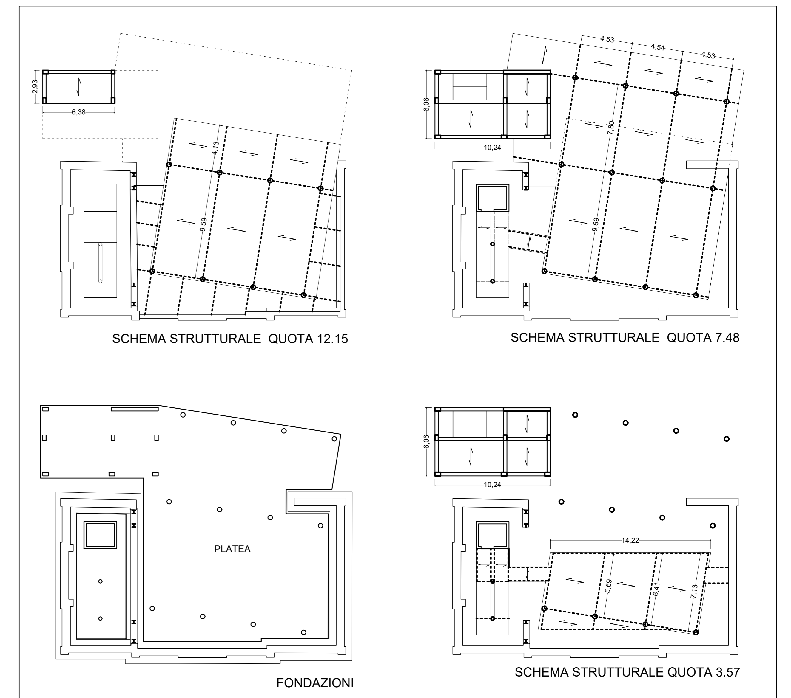
SCHEMI STRUTTURALI DEI VARI LIVELLI 1:200